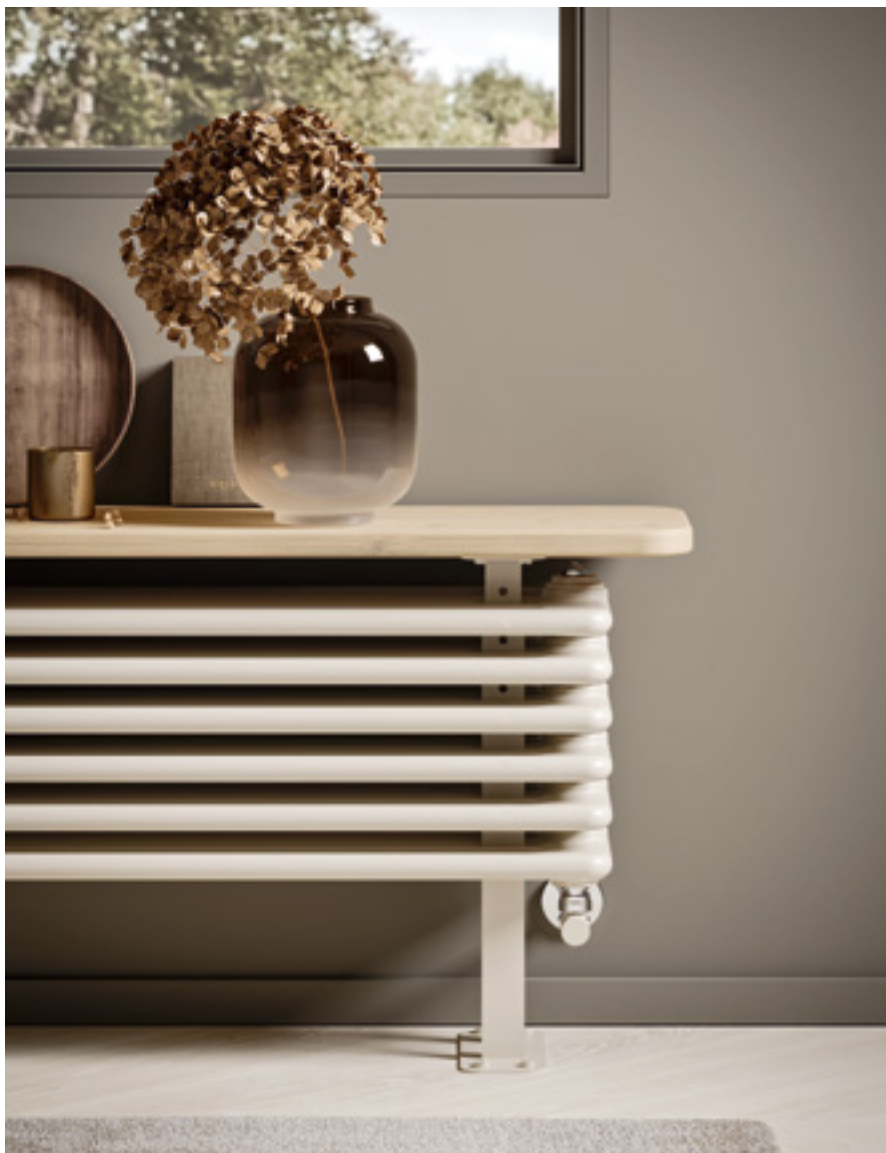
BANCADA NO SUMINISTRADA