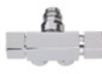
Válvula monotubo escuadra (Indicar en pedido)