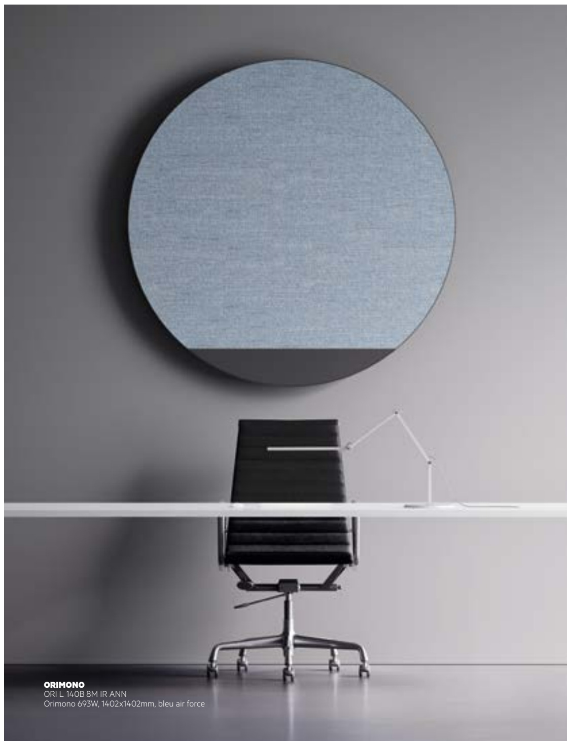
ORIMONO ORI L 140B 8M IR ANN Orimono 693W, 1402x1402mm, bleu air force