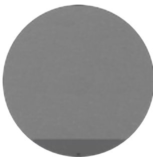
Textile Cendre Corniche Anthracite Opaque (6V)