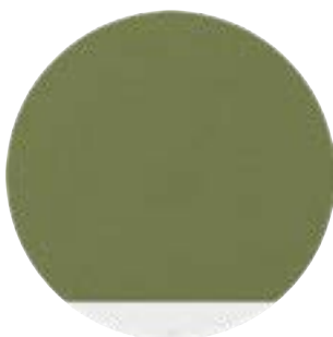
Textile Sauge Corniche Blanche (01)