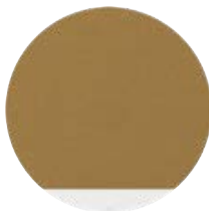
Textile Safran Corniche Blanche (01)