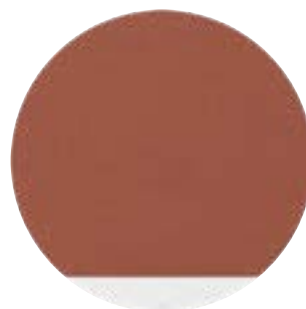
Textile Brique Corniche Blanche (01)