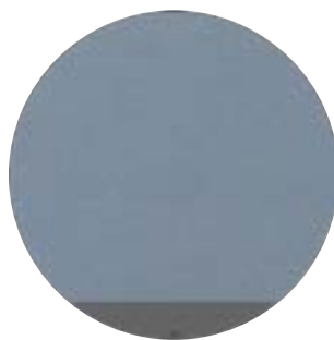
Textile Bleu Air Force Corniche Anthracite Opaque (6V)