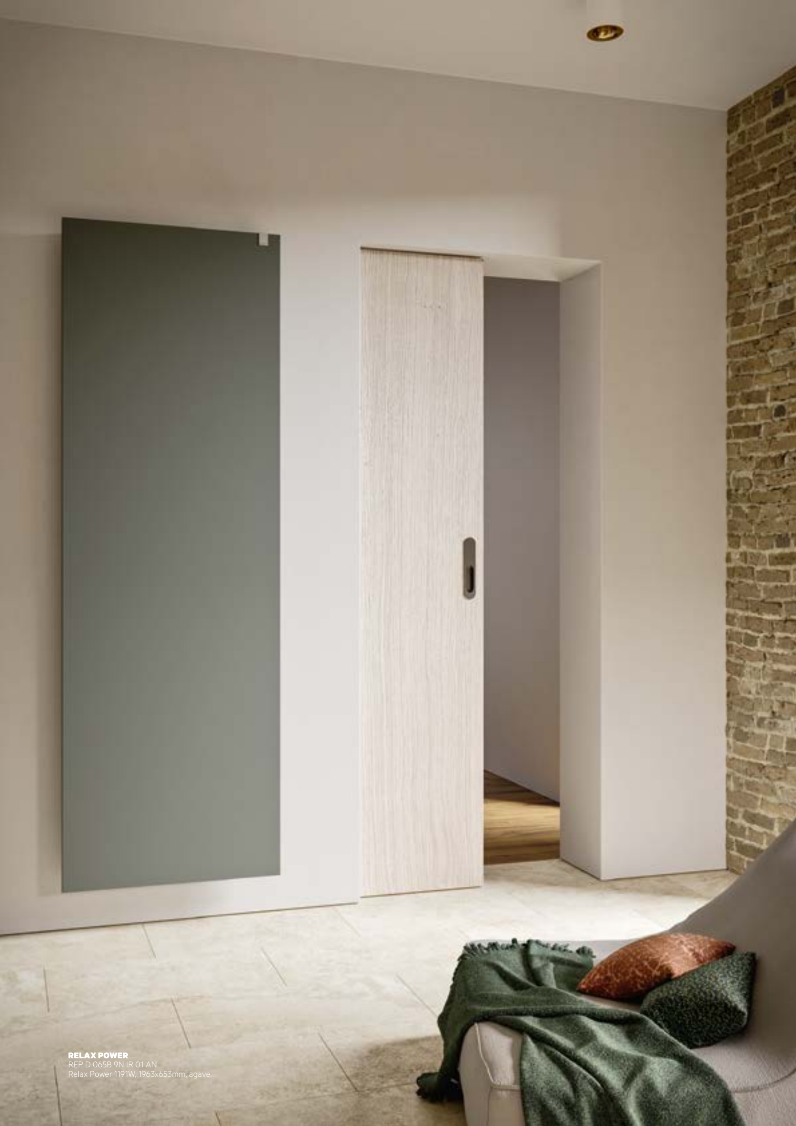
RELAX POWER REP D 065B 9N IR 01 AN Relax Power 1191W, 1963x653mm, agave