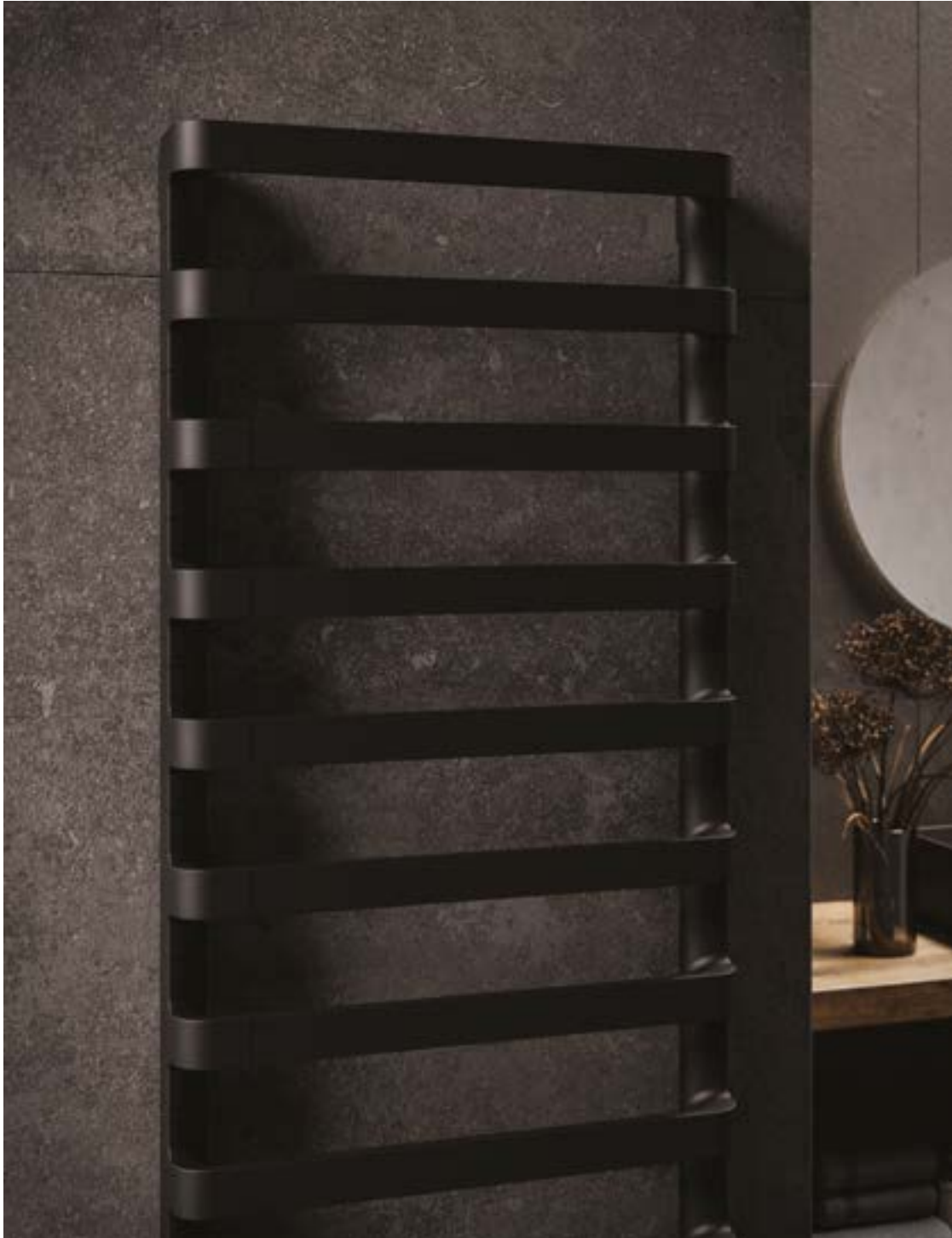
SALLE DE BAIN Radiateurs chauffage central