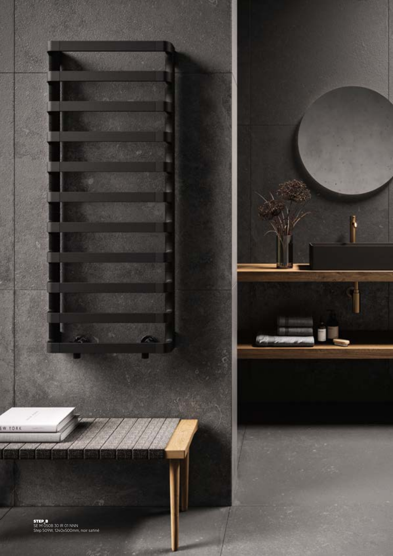
STEP_B SE M 050B 30 IR 01 NNN Step 509W, 1240x500mm, noir satiné