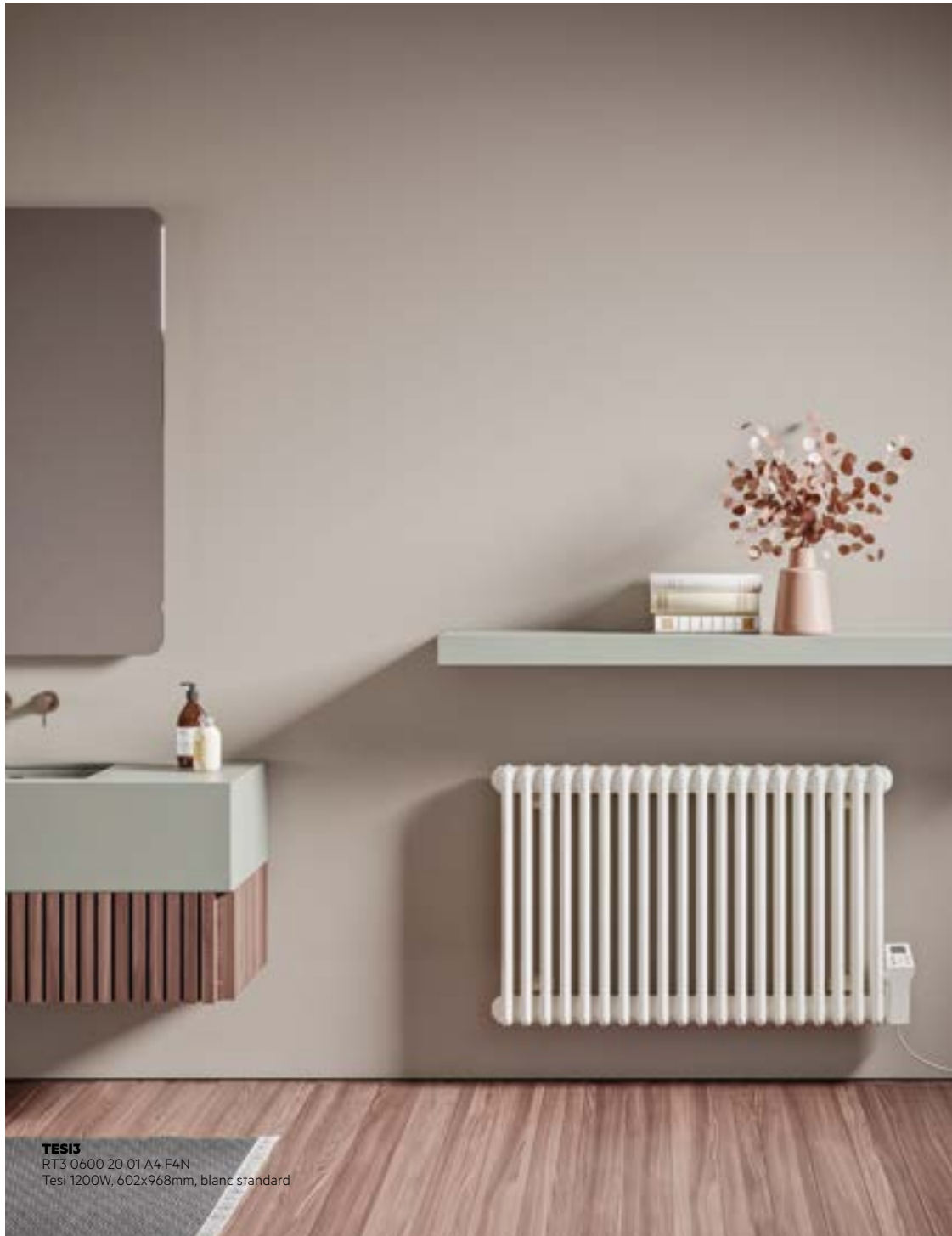
TESI3 RT3 0600 20 01 A4 F4N Tesi 1200W, 602x968mm, blanc standard