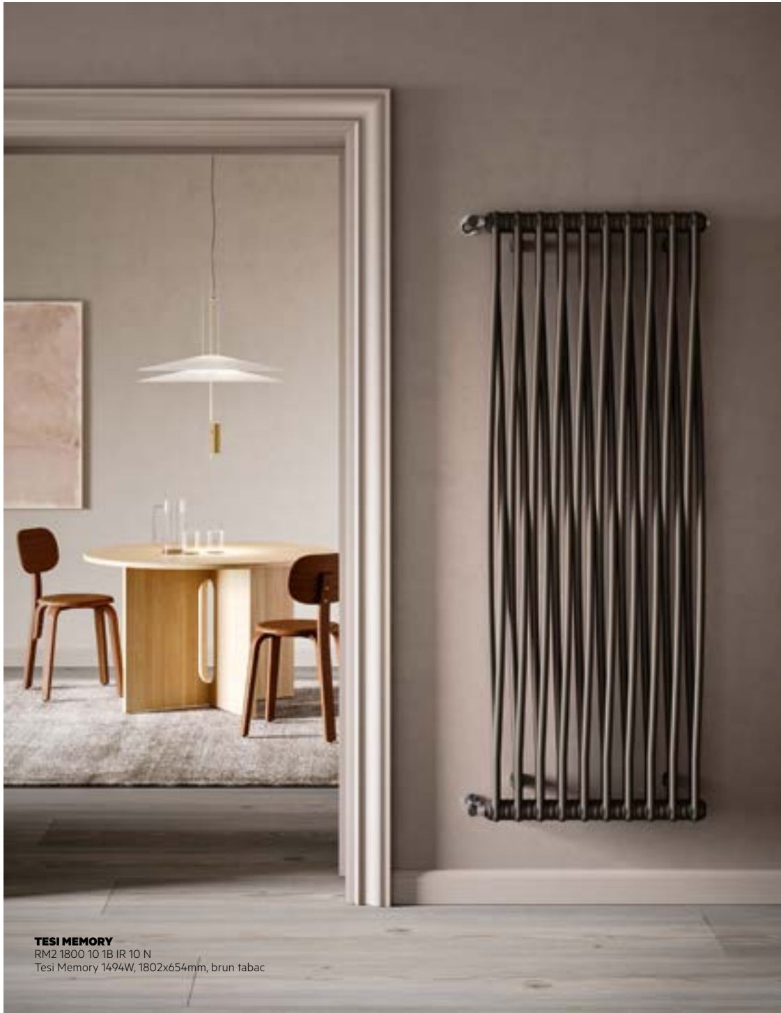
TESI MEMORY RM2 1800 10 1B IR 10 N Tesi Memory 1494W, 1802x654mm, brun tabac